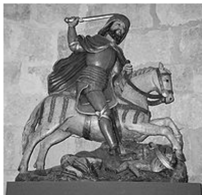
Santiago / San Séamas